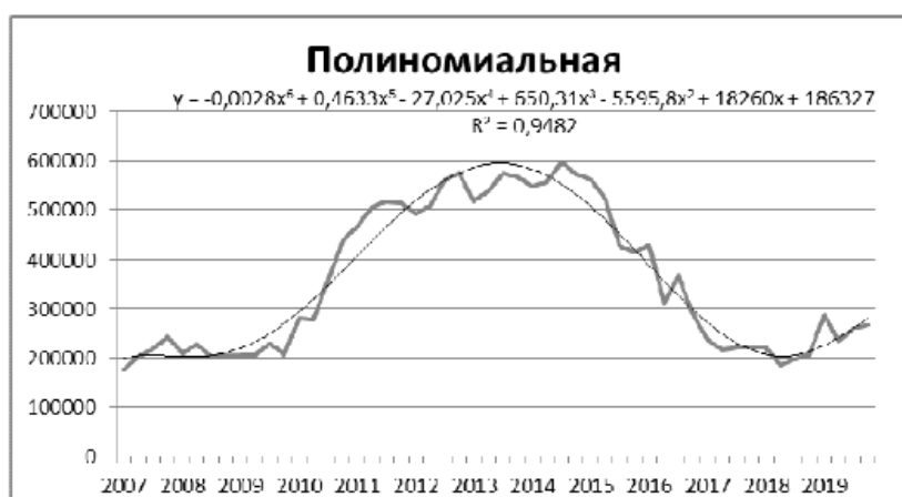
График динамики доходов банка «Приморье» поквартально в период с 2007 по 2019 год также полиномиальный тренд шестой степени приведены на рис. 3.

Сравнивая величины коэффициента детерминации по разным уровням тренда, можно сделать вывод, что лучшим является полином шестой степени, т.к. коэффициент там наиболее близок к единице.