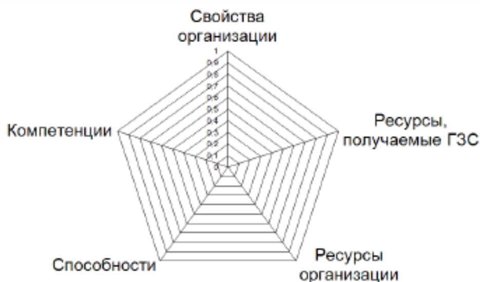
Рис. 2. Координатное пространство внутренней стратегической позиции

Внутренняя стратегическая позиция в вышеуказанной статье рассмотрена как «совокупность намерений в отношении развития ресурсов, способностей, компетенций и элементов потребительской стоимости бизнес-системы» [2. С. 30]. Для рассмотрения внутренней стратегической позиции в рамках стейкхолдерского подхода разделим элемент «ресурсы» на «ресурсы организации» и «ресурсы, получаемые ГЗС» [5], добавим элемент «свойства организации» и исключим из рассмотрения элемент «потребительная стоимость». Координатное пространство внутренней стратегической позиции представлено на рис. 2 [3].