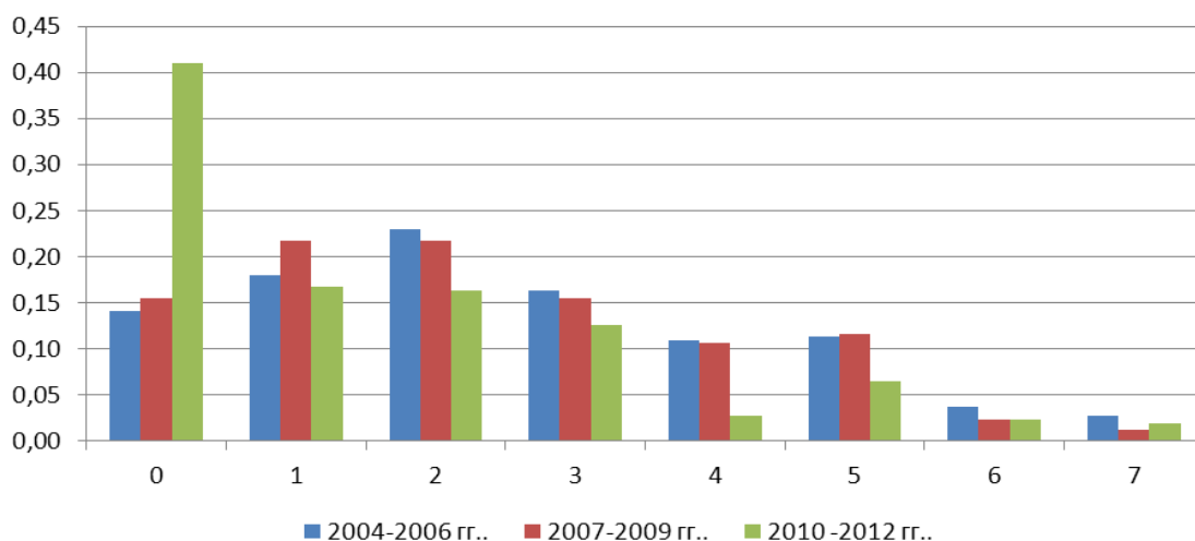
Рис. 2. Изменение структуры затрат времени студентов ВГУЭС на просмотр ТВ-программ

В своих исследованиях мы оценивали не только структуру различных моделей времяпрепровождения студентов, но и их желание увеличить время, посвящаемое различным видам времяпрепровождения. Анализ показал, что если бы студенты имели больше свободного времени то они хотели бы, в первую очередь, потратить его на компьютерные игры (увеличить на 76%), затем идет присутствие в Интернет (увеличить на 50%) и просмотр ТВ-программ (увеличить на 36%).