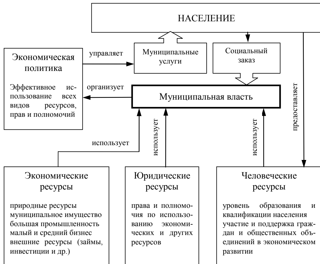
Рис. 1 Схема формирования муниципальной экономической политики

Развитие туристского предпринимательства является одним из важных элементов экономической политики муниципальных образований (рис. 1). В Приморском крае, обладающем уникальными природными ресурсами для развития туризма, участие муниципальных структур в этой сфере особенно актуально. Между тем, роль муниципальных образований в области развития туризма очень сильно недооценивается. Сегодня, муниципальные образования, не обладая финансовыми ресурсами, не проявляют необходимой инициативы в развитии этого важного сектора экономики для территории муниципалитета.